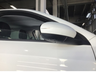
Dikiz aynası, sağ, Dış dikiz aynası > Çizik