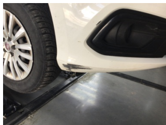
Tampon, ön, Ön tampon > Hasarlı