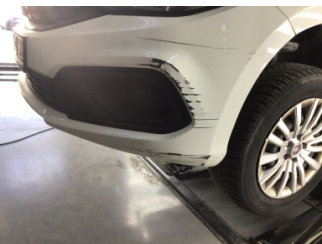
Tampon, ön, Ön tampon > Hasarlı