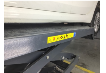
Marşbiyel, sol, Marşbiyel, sol > Hasarlı