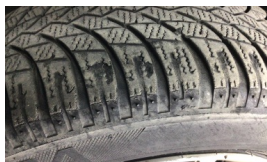
Lastik, ön > Deforme Olmuş