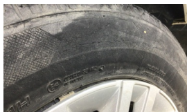
Lastik, arka > Deforme Olmuş