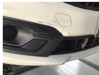
Tampon, ön, Ön tampon > Hasarlı