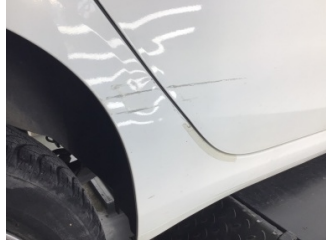
Kapı, sağ arka, Kapı, sağ arka > Çizik