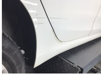
Kapı, sağ arka, Kapı, sağ arka > Ezik