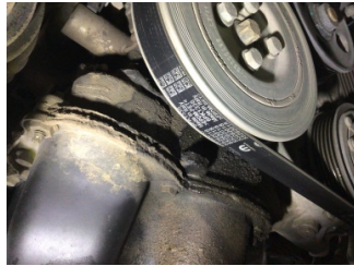
Motor, Triger zinciri kapağı > Yağ Kaçağı