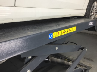
Marşbiyel, sağ, Marşbiyel, sağ > Ezik