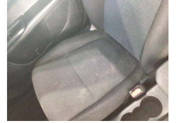
Koltuklar, ön, Koltuk, sağ ön > Kirlenmiş