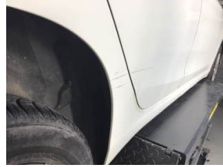
Çamurluk, sağ arka, Çamurluk, sağ arka > Çizik