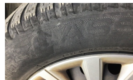
Lastik, ön > Deforme Olmuş