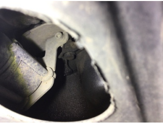
Motor, Triger zinciri kapağı > Yağ Kaçağı