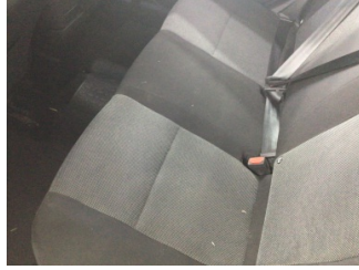
Koltuklar, arka, Arka koltuk > Kirlenmiş