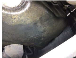
Motor, Triger zinciri kapağı > Yağ Kaçağı