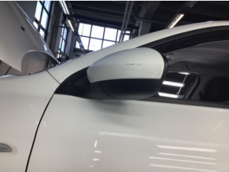
Dikiz aynası, sol, Dış dikiz aynası > Çizik