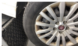
Jant kapağı seti > Hasarlı