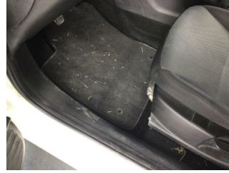
Taban, Taban halısı > Kirlenmiş