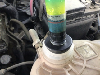
Motor, Silindir kapağı contası > Test Sonucu