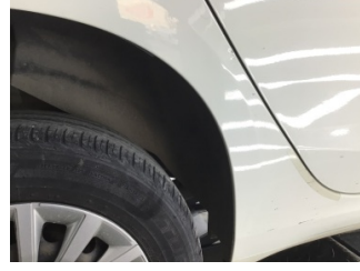
Çamurluk, sağ arka, Çamurluk, sağ arka > Ezik