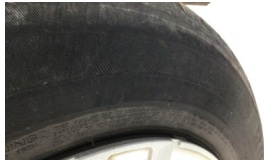
Lastik, ön > Deforme Olmuş