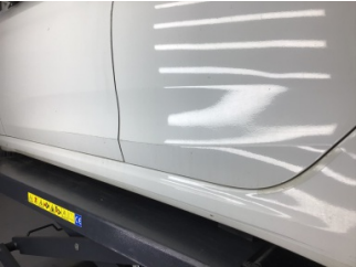
Kapı, sol arka, Kapı, sol arka > Çizik