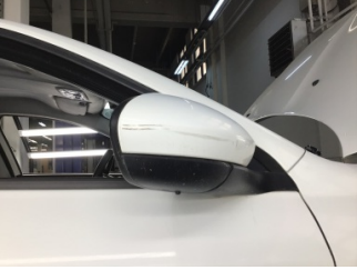
Dikiz aynası, sağ, Dış dikiz aynası > Çizik