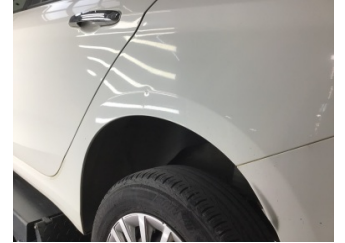
Çamurluk, sol arka, Çamurluk, sol arka > Noktasal Ezik