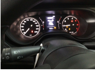
Motor, Bakım > Uyarı Lambası Yanıyor

Sayfa: 10/11 Araç Çıkış Tarihi: 14.10.2024 17:17