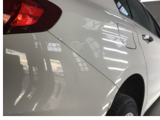
Çamurluk, sağ arka, Çamurluk, sağ arka > Ezik