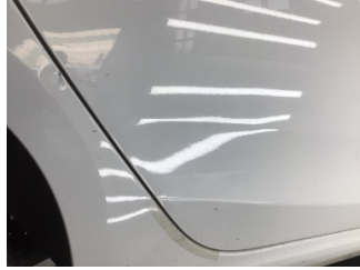
Kapı, sağ arka, Kapı, sağ arka > Çizik