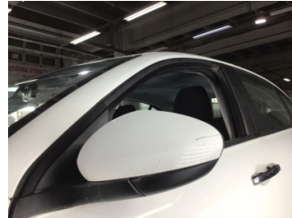
Dikiz aynası, sol, Dış dikiz aynası > Çizik