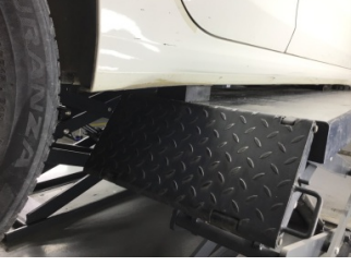
Marşbiyel, sağ, Marşbiyel, sağ > Ezik