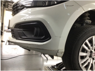
Tampon, ön, Ön tampon > Hasarlı