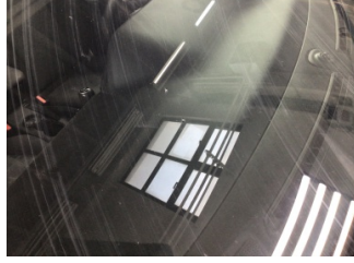
Camlar, Ön cam > Taş Vuruğu