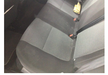
Koltuklar, arka, Arka koltuk > Kirlenmiş