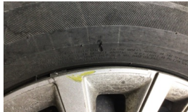
Lastik, ön > Hasarlı