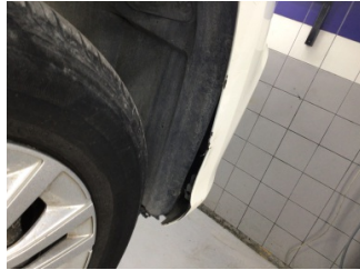
Tampon, ön, Ön tampon > Hasarlı