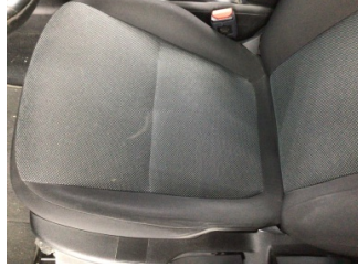
Koltuklar, ön, Koltuk, sol ön > Kirlenmiş