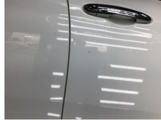
Kapı, sağ ön, Kapı, sağ ön > Noktasal Ezik