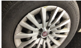
Jant kapağı seti > Çizik