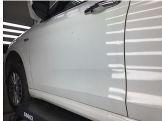
Kapı, sol ön, Kapı, sol ön > Çizik