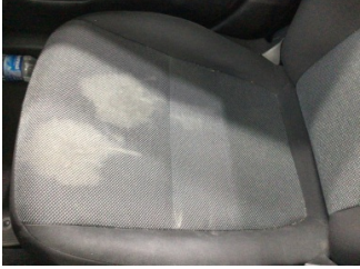
Koltuklar, ön, Koltuk, sağ ön > Kirlenmiş