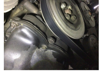
Motor, Triger zinciri kapağı > Yağ Kaçığı