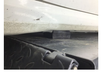
Marşbiyel, sol, Marşbiyel, sol > Ezik