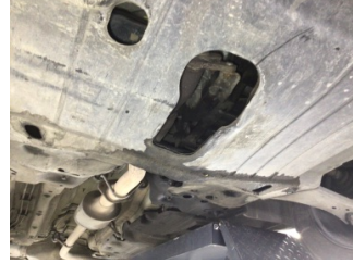
Motor, Alt muhafaza > Deforme Olmuş