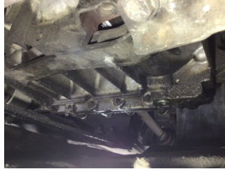
Şanzıman, Şanzıman > Yağ Kaçığı