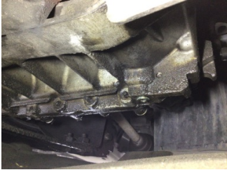
Şanzıman, Şanzıman > Yağ Kaçığı