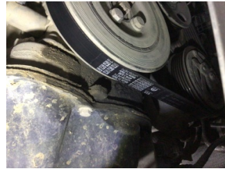
Motor, Yağ karteri > Yağ Kaçağı