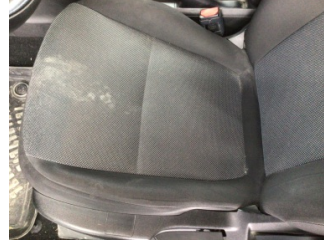
Koltuklar, ön, Koltuk, sol ön > Kirlenmiş