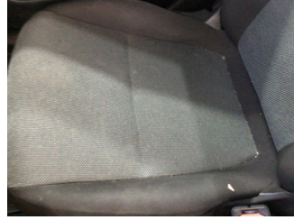
Koltuklar, ön, Koltuk, sağ ön > Kirlenmiş