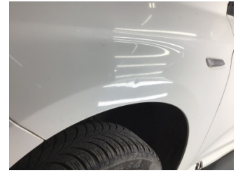
Çamurluk, sol, Çamurluk, sol > Noktasal Ezik