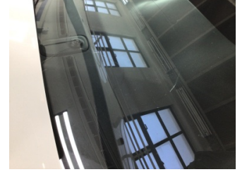
Camlar, Ön cam > Hasarlı