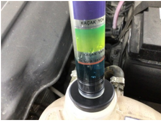
Motor, Silindir kapağı contası > Test Sonucu