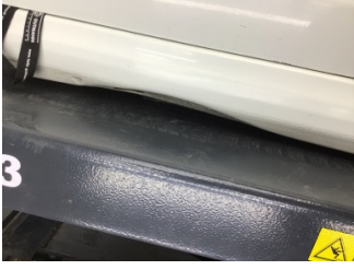
Marşbiyel, sol, Marşbiyel, sol > Ezik