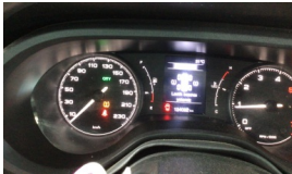
Tekerlek/Lastik > Uyarı Lambası Yanıyor