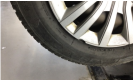
Jant kapağı seti > Hasarlı