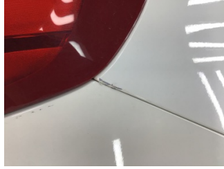
Çamurluk, sağ arka, Çamurluk, sağ arka > Boyası Atmış