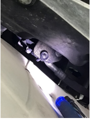
Motor, Motor > Yağ Kaçağı