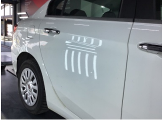
Kapı, sağ arka, Kapı, sağ arka > Ezik