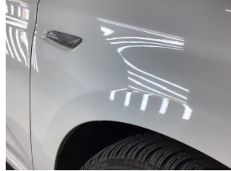
Çamurluk, sağ, Çamurluk, sağ > Çizik