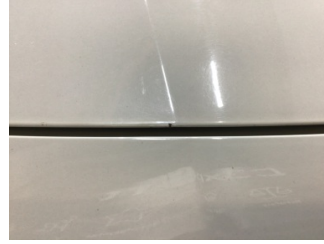
Motor kaputu, Motor kaputu > Taş İzi