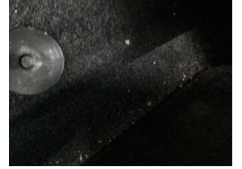
Taban, Taban halısı > Yakıcı Madde İle Zarar Görmüş