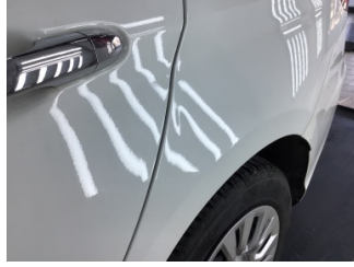
Çamurluk, sol arka, Çamurluk, sol arka > Ezik