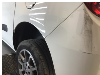
Çamurluk, sol arka, Çamurluk, sol arka > Noktasal Ezik