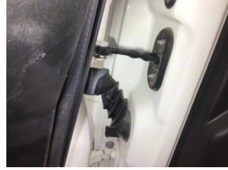
Kapı, sağ ön, Kapı gergisi > Ses Yapıyor