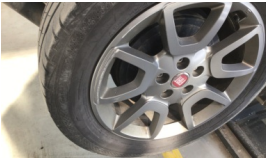
Jant, sağ arka > Çizik