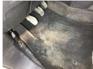
Taban, Taban halısı > Kirlenmiş