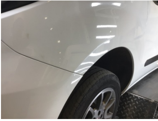
Çamurluk, sol, Çamurluk, sol > Çizik