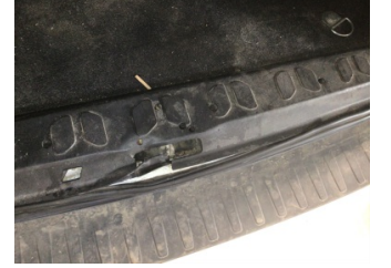
Döşemeler/Kapaklar, Bagaj bölümü döşemesi > Deforme Olmuş