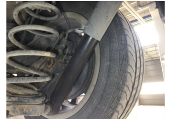
Arka aks, Amortisör, arka sağ > Sızdırıyor