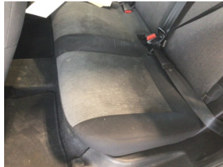
Koltuklar, arka, Arka koltuk > Kirlenmiş