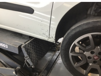
Çamurluk, sağ, Çamurluk, sağ > Kirlenmiş