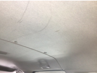
Döşemeler/Kapaklar, Tavan döşemesi > Deforme Olmuş