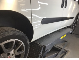
Kapı, sağ arka, Kapı, sağ arka > Ezik