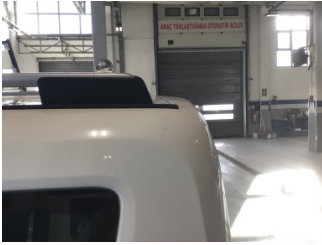
Çamurluk, sol arka, Çamurluk, sol arka > Çizik