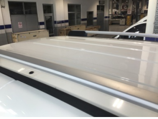
Tavan, Tavan > Noktasal Ezik