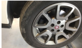
Jant, sol ön > Çizik