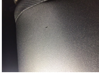
Koltuklar, arka, Arka koltuk > Yakıcı Madde Ile Zarar Görmüş