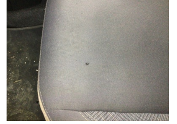
Koltuklar, ön, Koltuk, sol ön > Yakıcı Madde Ile Zarar Görmüş