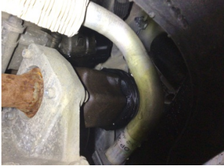
Motor, Yağ filtresi muhafazası > Yağ Kaçağı