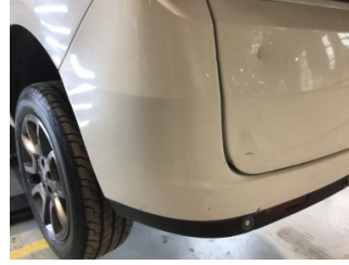
Tampon, arka, Arka tampon > Ezik