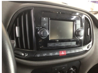
Komünikasyon/Navigasyon/Eğlence sistemleri, Radyo, CD, DVD > Çalışmıyor