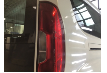
Arka lambalar, Arka lambalar, sağ > Hasarlı