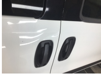
Kapı, sağ arka, Kapı, sağ arka > Ezik