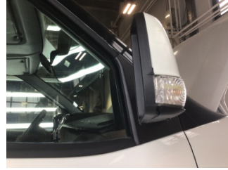
Dikiz aynası, sağ, Dış dikiz aynası çerçevesi > Hasarlı