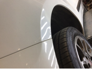
Çamurluk, sol, Çamurluk, sol > Ezik