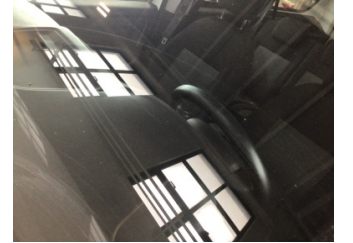
Camlar, Ön cam > Taş İzi