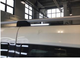
Çamurluk, sol arka, Çamurluk, sol arka > Yakıcı Madde İle Zarar Görmüş

Sayfa: 10/11 Araç Çıkış Tarihi: 15.02.2025 11:58