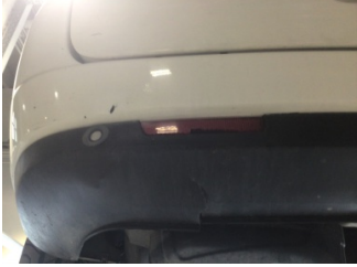
Tampon, arka, Reflektör, sol > Hasarlı