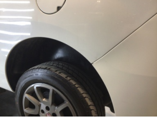
Çamurluk, sol arka, Çamurluk, sol arka > Çizik