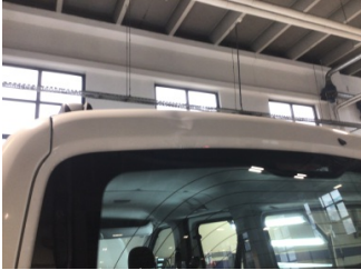
Bagaj kapağı/kapısı, Bagaj kapısı > Hasarlı