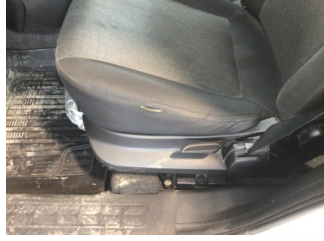
Koltuklar, ön, Koltuk, sol ön > Deforme Olmuş