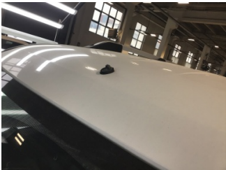
Komünikasyon/Navigasyon/Eğlence sistemleri, Anten > Hasarlı