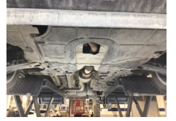
Motor, Alt muhafaza > Ezik