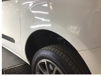
Çamurluk, sağ, Çamurluk, sağ > Ezik