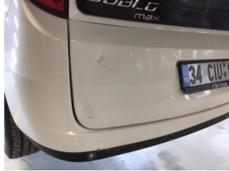
Bagaj kapağı/kapısı, Arka spoiler > Hasarlı