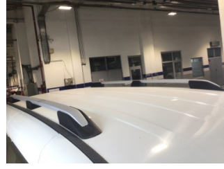
Tavan, Tavan > Ezik