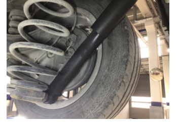
Arka aks, Amortisör, arka sağ > Deforme Olmuş