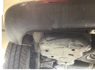
Tampon, arka, Spoiler > Hasarlı