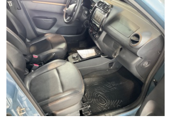
Döşemeler/Kapaklar, Döşemeler/Kapaklar > Kirlenmiş