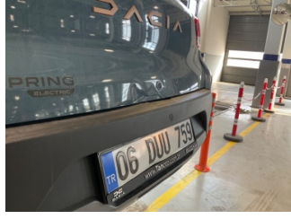
Tampon, arka, Arka tampon > Hasarlı