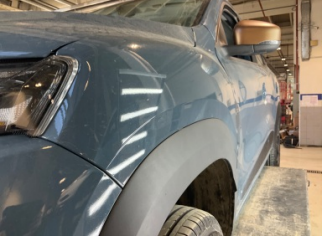
Çamurluk, sol, Çamurluk, sol > Noktasal Ezik