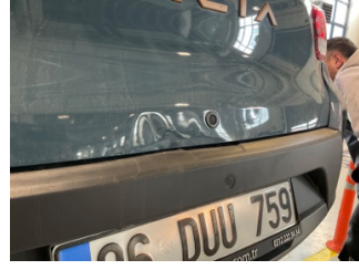
Bagaj kapağı/kapısı, Bagaj kapısı > Hasarlı