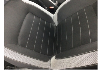
Koltuklar, ön, Koltuk, sol ön > Kirlenmiş