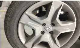
Jant kapağı seti > Deforme Olmuş