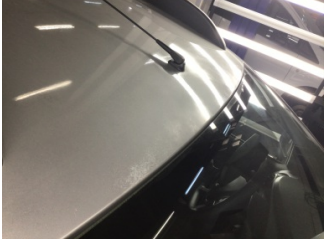
Tavan, Tavan > Boyası Atmış