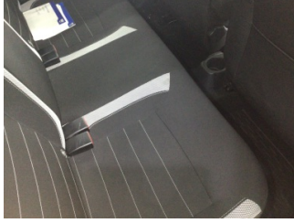
Koltuklar, arka, Arka koltuk > Kirlenmiş