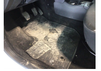
Taban, Paspaslar > Deforme Olmuş