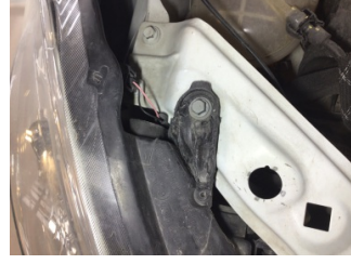
Farlar, Far, sağ > Hasarlı