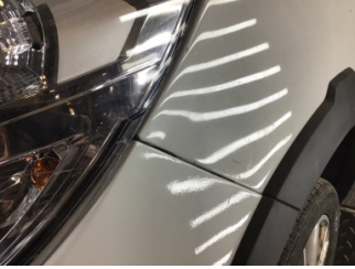
Tampon, ön, Ön tampon > Standart Dışı Onarım