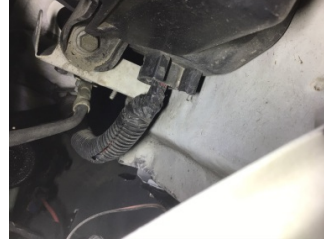
Kaporta, Sol Podye Sacı > Hasarlı