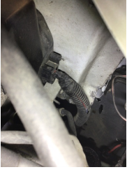
Kaporta, Sol Podye Sacı > Standart Dışı Onarım