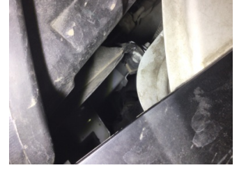
Farlar, Far, sağ > Standart Dışı Onarım