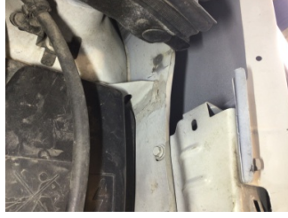
Kaporta, Sol Podye Sacı > Standart Dışı Onarım