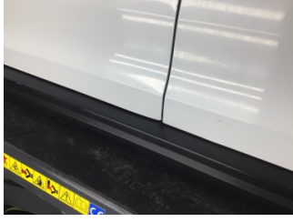
Kapı, sol ön, Kapı, sol ön > Ezik