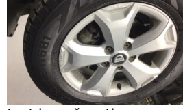
Jant kapağı seti > Deforme Olmuş