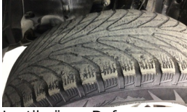
Lastik, ön > Deforme Olmuş