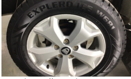
Jant kapağı seti > Deforme Olmuş