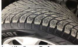
Lastik, ön > Deforme Olmuş