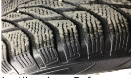
Lastik, arka > Deforme Olmuş