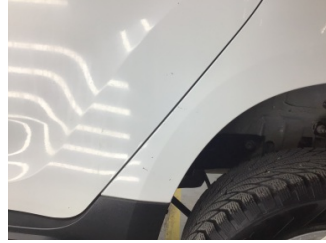
Çamurluk, sol arka, Çamurluk, sol arka > Çizik