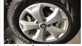
Jant kapağı seti > Deforme Olmuş