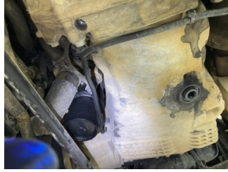
Motor, Motor > Yağ Kaçağı