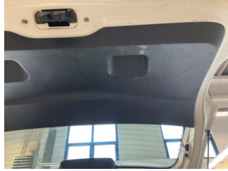
Döşemeler/Kapaklar, Bagaj bölümü döşemesi > Çizik