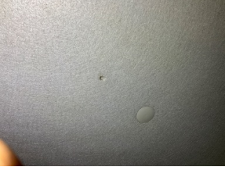
Döşemeler/Kapaklar, Tavan döşemesi > Hasarlı