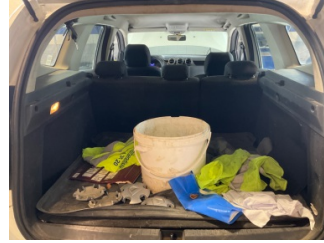
Döşemeler/Kapaklar, Bagaj bölümü döşemesi > Çizik