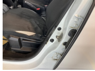
Kapı, sol ön, Kapı fitili > Hasarlı