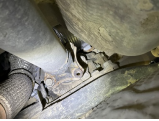
Şanzıman, Kardan mili, orta > Sabitlemesi Hatalı