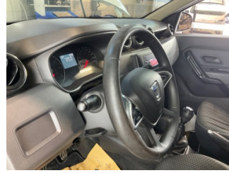
Direksiyon sistemi, Direksiyon simidi > Deforme Olmuş