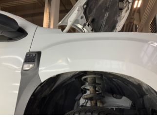
Çamurluk, sağ, Çamurluk, sağ > Ezik