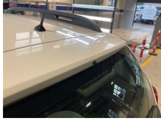
Bagaj kapağı/kapısı, Bagaj kapısı > Noktasal Ezik