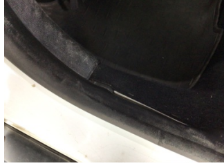
Taban, Yer döşemesi, sol arka > Sabitlemesi Hatalı