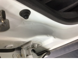
Kaporta, B-direk, sağ > Ezik