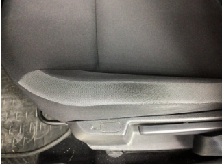
Koltuklar, ön, Koltuk döşemesi, sol ön > Deforme Olmuş