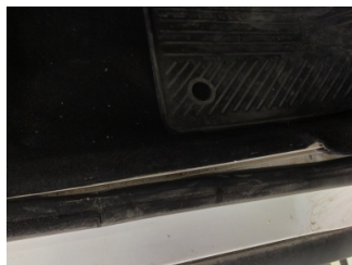
Taban, Yer döşemesi, sağ ön > Sabitlemesi Hatalı