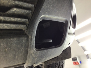
Tampon, ön, Çeki demir kapağı > Sökülmüş-Yok