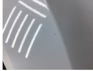
Çamurluk, sağ, Çamurluk, sağ > Taş Izi