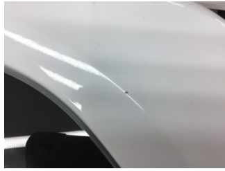
Çamurluk, sol arka, Çamurluk, sol arka > Taş Izi