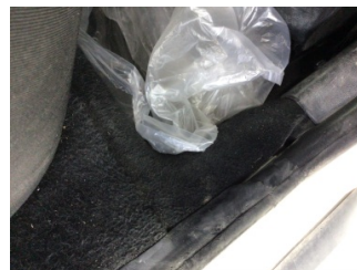
Taban, Yer döşemesi, sağ arka > Sabitlemesi Hatalı