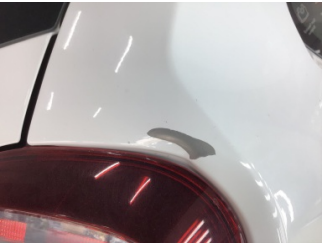
Çamurluk, sağ arka, Çamurluk, sağ arka > Hasarlı