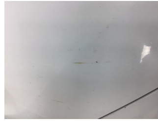
Kapı, sol arka, Kapı, sol arka > Taş Izi