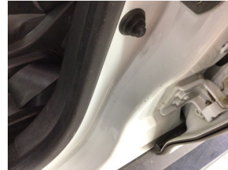
Kaporta, B-direk, sol > Çizik