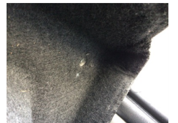
Döşemeler/Kapaklar, Pandizot > Sabitlemesi Hatalı