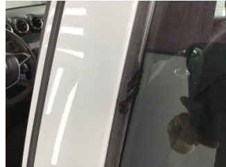
Kapı, sol arka, Cam sıyrıcı fitili, dış > Çizik