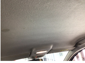
Döşemeler/Kapaklar, Tavan döşemesi > Deforme Olmuş

Sayfa: 10/11 Araç Çıkış Tarihi: 06.09.2024 13:01