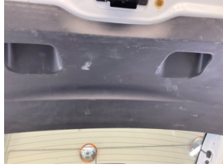
Döşemeler/Kapaklar, Döşemeler/Kapaklar > Çizik