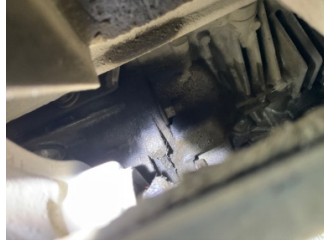
Motor, Motor > Yağ Kaçağı