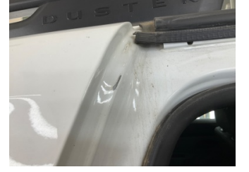
Kaporta, C-direk, sağ > Boyası Atmış