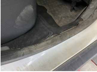
Taban, Taban halısı > Sabitlemesi Hatalı