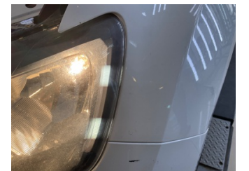
Çamurluk, sol, Çamurluk, sol > Taş İzi