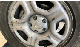
Jant, sol ön > Boyası Atmış