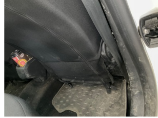
Koltuklar, ön, Koltuk döşemesi, sağ ön > Hasarlı