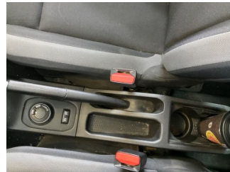
Döşemeler/Kapaklar, Döşemeler/Kapaklar > Kirlenmiş