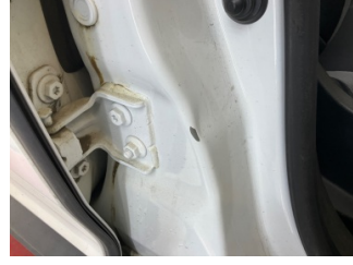
Kaporta, B-direk, sağ > Hasarlı