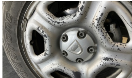
Jant, sağ ön > Boyası Atmış