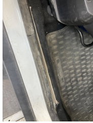
Taban, Taban halısı > Sabitlemesi Hatalı