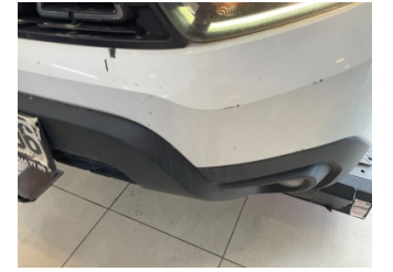
Tampon, ön, Ön tampon > Boyası Atmış