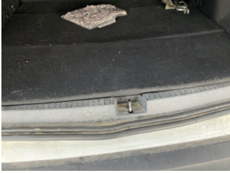
Döşemeler/Kapaklar, Döşemeler/Kapaklar > Çizik