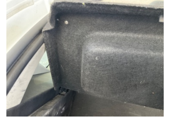
Döşemeler/Kapaklar, Pandizot > Sabitlemesi Hatalı