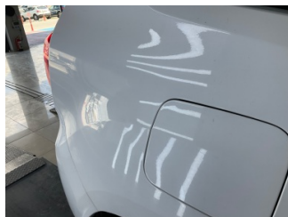
Çamurluk, sağ arka, Çamurluk, sağ arka > Hasarlı