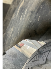
Çamurluk, sağ arka, Davlumbaz > Hasarlı