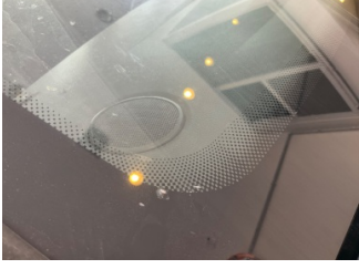
Camlar, Ön cam > Taş Vuruğu

Sayfa: 10/12 Araç Çıkış Tarihi: 04.09.2024 14:28