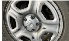
Jant, sağ arka > Boyası Atmış