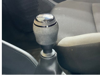
Şanzıman, Vites topuzu > Deforme Olmuş