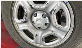
Jant, sol arka > Boyası Atmış