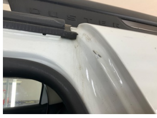
Kaporta, C-direk, sol > Boyası Atmış