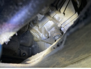
Motor, Motor > Yağ Kaçağı