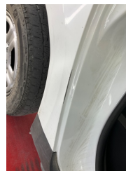
Çamurluk, sağ arka, Çamurluk, sağ arka > Hasarlı