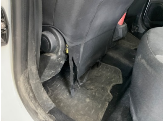
Koltuklar, ön, Koltuk döşemesi, sol ön > Hasarlı