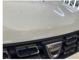
Motor kaputu, Motor kaputu > Taş İzi