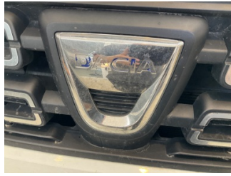
İlave parçalar, ön, Ön panjur > Boyası Atmış