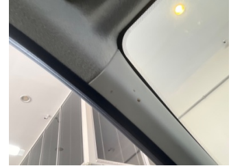
Döşemeler/Kapaklar, Döşemeler/Kapaklar > Kirlenmiş