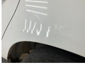
Çamurluk, sol arka, Çamurluk, sağ sol arka > Ezik