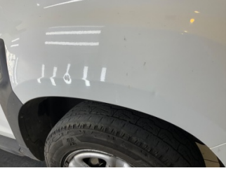
Çamurluk, sağ, Çamurluk, sağ > Ezik