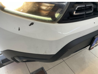
Tampon, ön, Ön tampon > Boyası Atmış