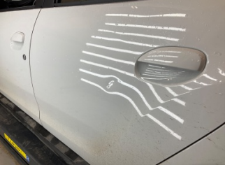
Kapı, sol arka, Kapı, sol arka > Ezik