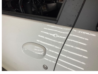
Kapı, sol ön, Kapı, sol ön > Ezik