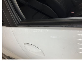
Kapı, sağ ön, Kapı, sağ ön > Ezik