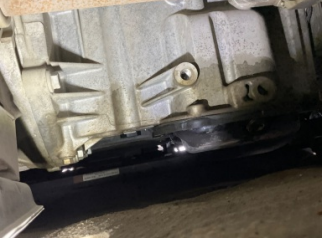
Motor, Yağ karteri > Yağ Kaçağı