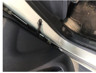
Kapı, sol ön, Kapı gergisi > Ses Yapıyor