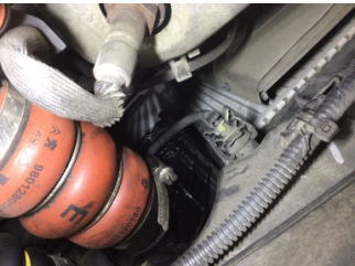
Motor, Turbo hava soğutucusu > Yağ Kaçağı