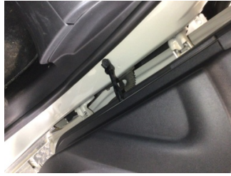
Kapı, sağ ön, Kapı gergisi > Ses Yapıyor