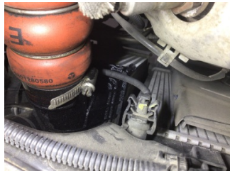
Motor, Turbo hava soğutucusu > Yağ Kaçağı