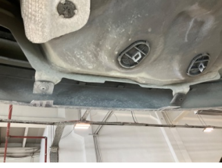
Tampon, arka, Bağlantı ayağı > Hasarlı