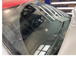
Camlar, Ön cam > Taş İzi