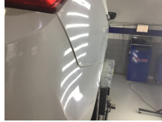
Çamurluk, sağ arka, Çamurluk, sağ arka > Çizik