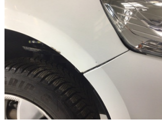
Tampon, ön, Ön tampon > Ayarsız