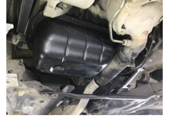
Motor, Yağ karteri > Yağ Kaçağı