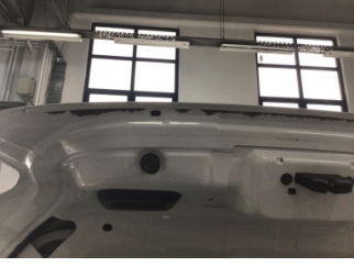
Bagaj kapağı/kapısı, Bagaj kapısı > Pas

Sayfa: 10/12 Araç Çıkış Tarihi: 24.12.2024 10:54