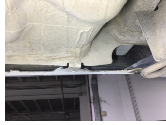
Arka bölüm, Arka sac/panel > Ezik