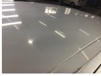
Tavan, Tavan > Ezik