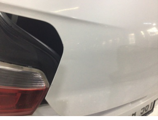
Bagaj kapağı/kapısı, Bagaj kapısı > Ezik