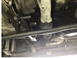
Motor, Yağ karteri > Yağ Kaçağı