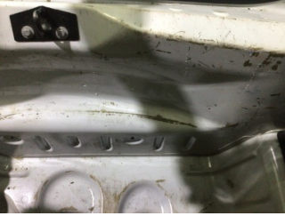
Arka bölüm, Bagaj havuzu > Çizik