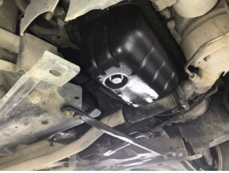
Motor, Yağ karteri > Yağ Kaçağı