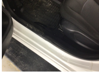
Kapı, sol ön, Kapı fitili > Hasarlı