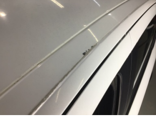
Tavan, Tavan > Taş İzi