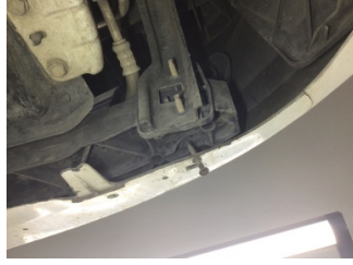
Tampon, ön, Bağlantı ayağı > Hasarlı