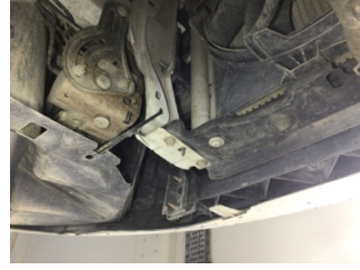
Tampon, ön, Bağlantı ayağı > Hasarlı