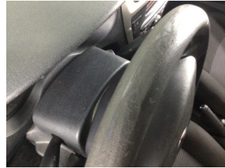
Direksiyon sistemi, Direksiyon simidi > Deforme Olmuş