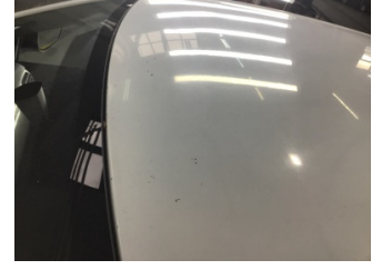
Tavan, Tavan > Taş İzi