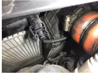
Motor, Turbo hortumları > Yağ Kaçağı