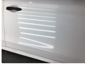
Kapı, sağ ön, Kapı, sağ ön > Çizik