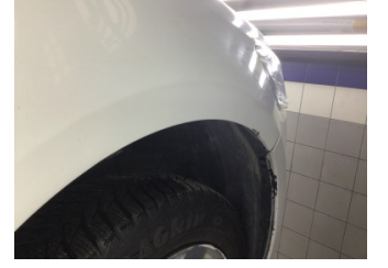
Çamurluk, sağ, Çamurluk, sağ > Ezik