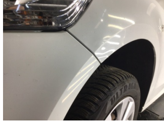
Çamurluk, sol, Çamurluk, sol > Ezik