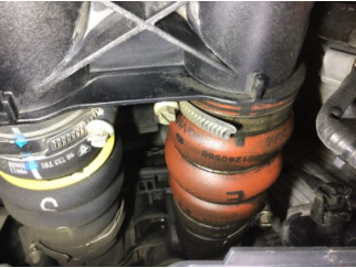
Motor, Turbo hortumları > Yağ Kaçağı