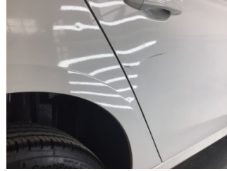
Kapı, sağ arka, Kapı, sağ arka > Çizik