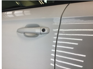
Kapı, sol ön, Kapı, sol ön > Çizik