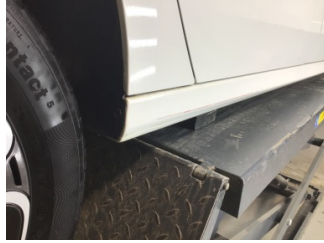
Marşbiyel, sağ, Marşbiyel, sağ > Çizik