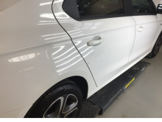
Çamurluk, sağ arka, Çamurluk, sağ arka > Noktasal Ezik