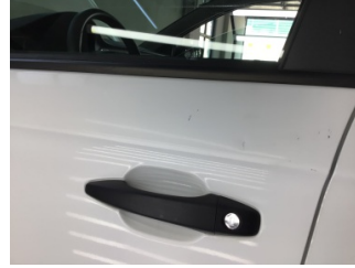
Kapı, sol ön, Kapı, sol ön > Çizik