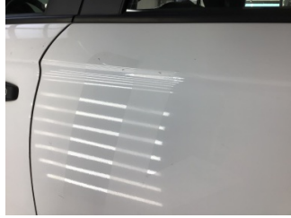
Kapı, sol arka, Kapı, sol arka > Çizik