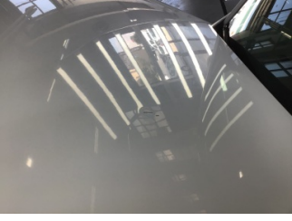
Motor kaputu, Motor kaputu > Ezik