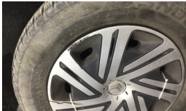
Jant kapağı seti > Çizik