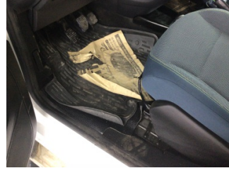
Taban, Taban halısı > Kirlenmiş Pas