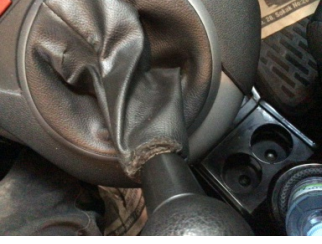
Şanzıman, Vites körüğü > Hasarlı