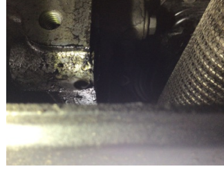
Şanzıman, Şanzıman > Yağ Kaçağı