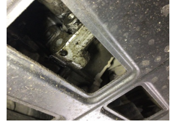
Şanzıman, Şanzıman > Yağ Kaçağı