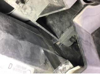
Farlar, Far, sağ > Standart Dışı Onarım