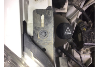
Farlar, Far, sağ > Standart Dışı Onarım