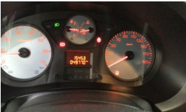
Tekerlek/Lastik > Uyarı Lambası Yanıyor