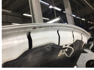
Motor kaputu, Motor kaputu > Pas