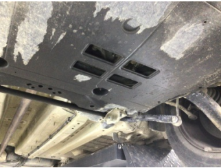
Şanzıman, Şanzıman > Yağ Kaçağı