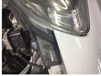
Farlar, Far, sağ > Hasarlı