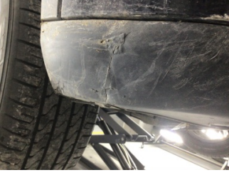
Tampon, ön, Spoiler > Hasarlı