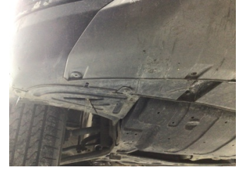
Tampon, ön, Spoiler > Hasarlı