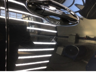
Kapı, sağ ön, Kapı, sağ ön > Çizik