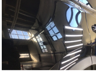
Çamurluk, sağ arka, Çamurluk, sağ arka > Çizik