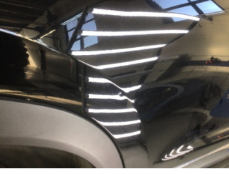
Kapı, sağ arka, Kapı, sağ arka > Noktasal Ezik