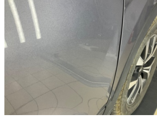
Kapı, sağ ön, Kapı, sağ ön > Ezik