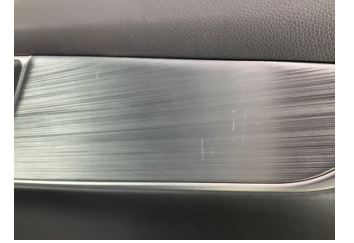
Döşemeler/Kapaklar, Kapı döşemesi, sağ arka > Çizik