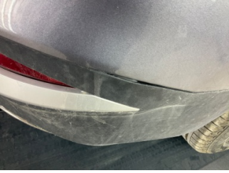
Tampon, arka, Spoyley > Sabitlemesi Hatalı