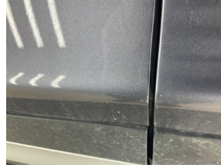
Kapı, sol ön, Kapı, sol ön > Çizik