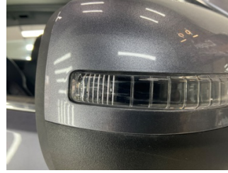
Dikiz aynası, sağ, Sinyal lambası > Yüzeysel Çizik