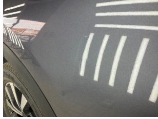
Kapı, sağ arka, Kapı, sağ arka > Noktasal Ezik