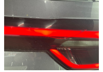
Arka lambalar, Arka lamba camı, sağ > Hasarlı