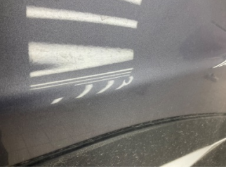
Kapı, sol arka, Kapı, sol arka > Noktasal Ezik