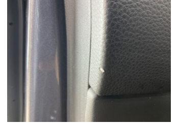
Döşemeler/Kapaklar, Kapı döşemesi, sol ön > Deforme Olmuş