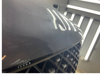
Motor kaputu, Motor kaputu > Noktasal Ezik