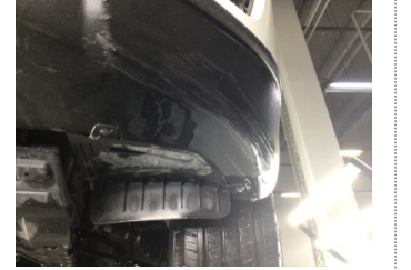
Tampon, ön, Spoyley > Çizik