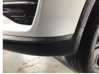
Tampon, ön, Spoyley > Çizik