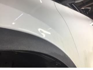
Çamurluk, sol, Çamurluk, sol > Ezik