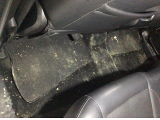
Döşemeler/Kapaklar, Döşemeler/Kapaklar > Kirlenmiş