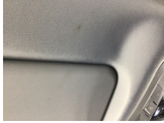
Döşemeler/Kapaklar, Tavan döşemesi > Yakıcı Madde İle Zarar Görmüş