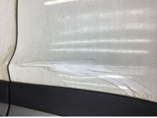
Kapı, sol arka, Kapı, sol arka > Çizik