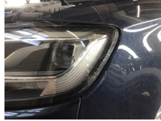
Çamurluk, sol, Çamurluk, sol > Çizik