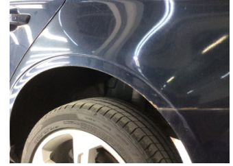
Çamurluk, sol arka, Çamurluk, sol arka > Boyası Atmış