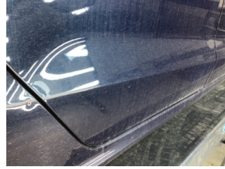
Kapı, sağ arka, Kapı, sağ arka > Standart Dışı Onarım