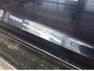
Kapı, sağ ön, Kapı, sağ ön > Standart Dışı Onarım