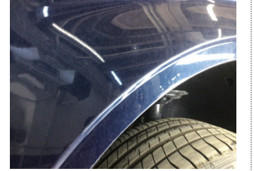
Çamurluk, sol, Çamurluk, sol > Çizik